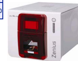
Принтер Evolis Zenius USB