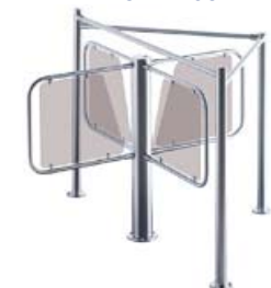
Турникет PERCo-RTD-03S с формирователем PERCo-RB-03S