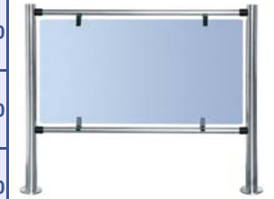
Стационарная секция ограждения серии PERCo-BH01 с прямыми патрубками и заполнением