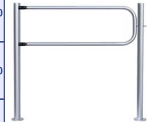
Поворотная секция ограждения серии PERCo-BH01 с шарнирами