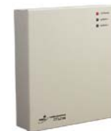
Контроллер замка/турникета PERCo-CT/L04