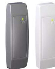
Считыватели PERCo-RP-15.2 PERCo-RP-14.1MW