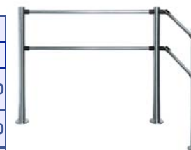
Стационарная секция ограждения серии PERCo-BH01 с прямыми и поворотными патрубками