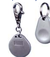
EM-Marin proximity key tags