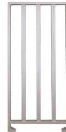
Секция полноростового ограждения серии PERCo-MB-15