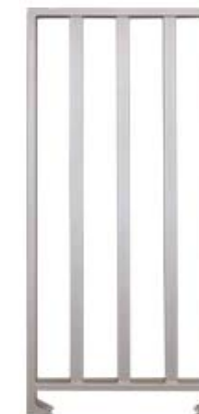
Секция полноростового ограждения серии PERCo-MB-15