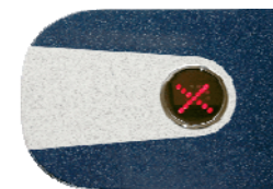
Крышка турникета с индикатором PERCo-C-03G blue