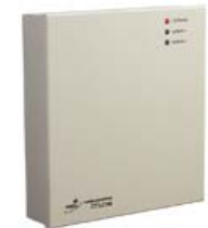
Контроллер замка/турникета PERCo-CT/L04