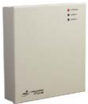
Контроллер замка/турникета PERCo-CT/L04