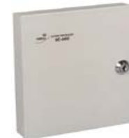
Контроллер турникета PERCo-SC-610T/L-1