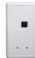
Контроллер конфигурации PERCo-SC-810