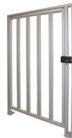
Полноростовая калитка PERCo-WHD-15R