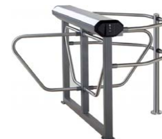
Электронная проходная PERCo-KR05.3