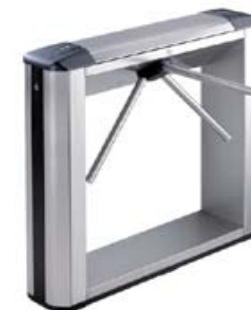
Электронная проходная PERCo-KTC01.3 в комплекте со стандартными планками