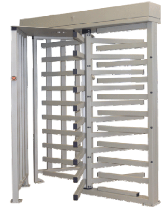
Полноростовый роторный турникет PERCo-RTD-15R