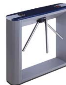
Тумбовый турникет-трипод с планками Антипаника PERCo-TTD-03.1G