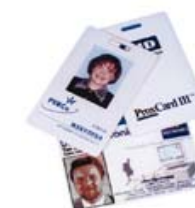
EM-Marin proximity cards