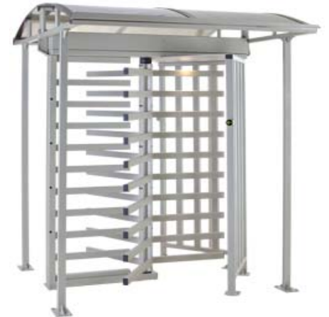
Полноростовый роторный турникет PERCo-RTD-15R с крышей PERCo-RTC-15R