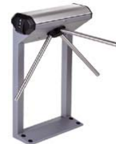
Электронные проходные PERCo-KT02.3 и PERCo-KT02.7 в комплекте со стандартными планками