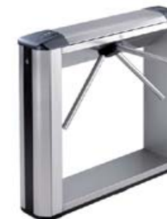
Электронная проходная PERCo-KT05.3 в комплекте со стандартными планками