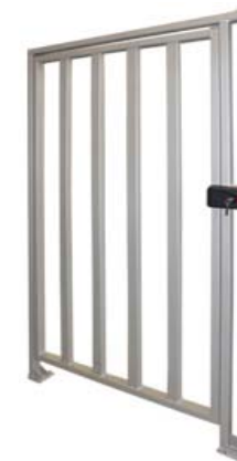
Полноростовая калитка PERCo-WHD-15R