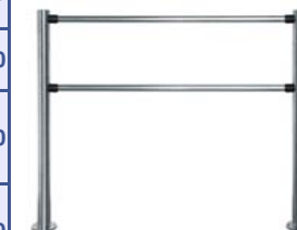
Стационарная секция ограждения серии PERCo-BH01 с прямыми патрубками