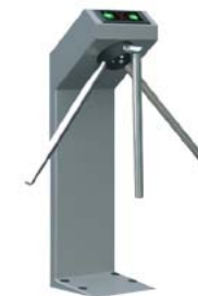
Турникет-трипод с планками Антипаника PERCo-TTR-04.1G

1. Под заказ возможна окраска турникетов в другие цвета по каталогу RAL. Срок изготовления и стоимость оговариваются дополнительно.