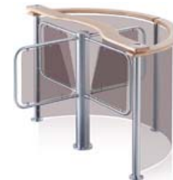
Турникет PERCo-RTD-03S с формирователем PERCo-RB-03TP