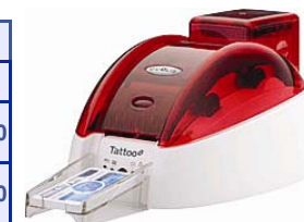
Принтер Evolis Tattoo2 Basic USB