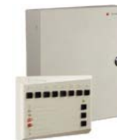
Прибор приемно-контрольный охранно-пожарный PERCo-PU01