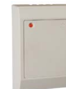
Контроллер управления доступом PERCo-SC-800